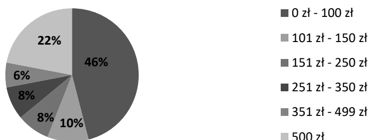
Rysunek 2. Miesięczne oszczędności z programu „Rodzina 500+” w lubelskich gospodarstwach domowych

W ankiecie pojawiło się również pytanie dotyczące tego, czy respondenci są w stanie zaoszczędzić część pieniędzy pobieranych w ramach świadczenia „Rodzina 500+”. Na rysunku 2. zaprezentowano uzyskane wyniki.